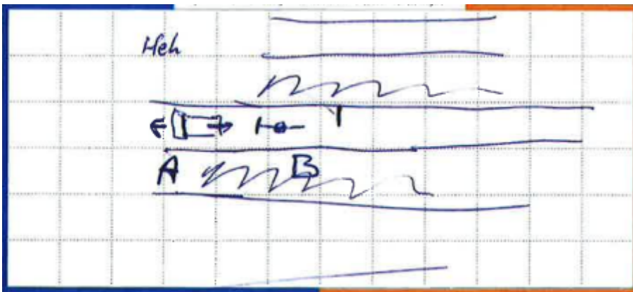
Figuur 1: situatieschets 1

Op de achterzijde van het formulier heeft de wederpartij, in antwoord op de vraag wie aansprakelijk is, ingevuld: 'Ik reed vooruit. Tp is achterop gereden.'